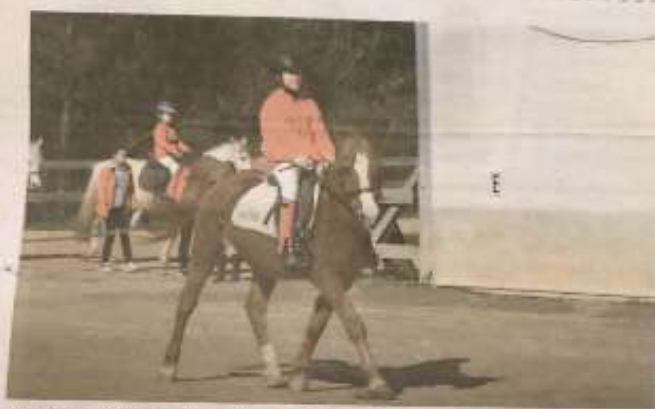
Una de las jinetes durante su salida a pista.