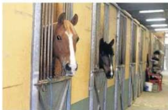
Caballos en las cuadras en una imagen de archivo.