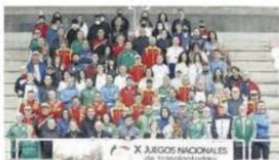
Participantes en la prueba de atletismo disputada ayer en la gijonesa pista de Las Mestas.