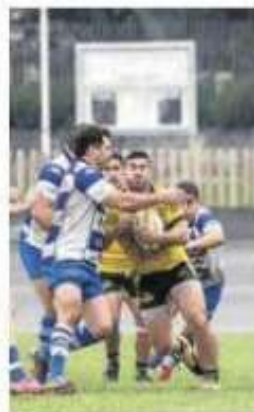
Una jugada defensiva del Pasek Belenos.

Hoy se cierra el campeonato regional con la jornada decisiva en las categorías absoluta, juvenil primera, clásicos 1.20, infantiles primera, clásicos 1.10 y alevines primera, además de las diferentes categorías de ponis.