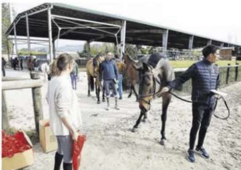
Participantes a la espera de pasar el examen veterinario durante la tarde de ayer.