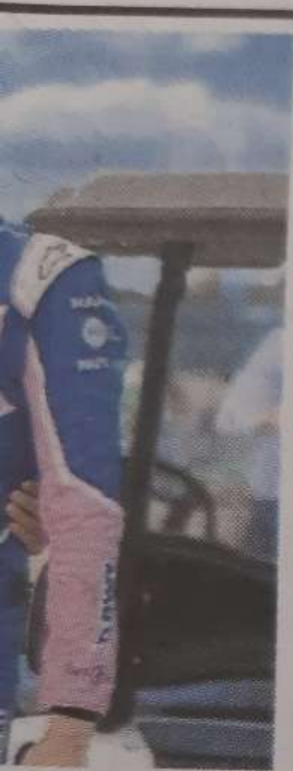
al. F. A.

el mono de r de otra de s ruedas, ro- garó con unas ada incluyó al museo.