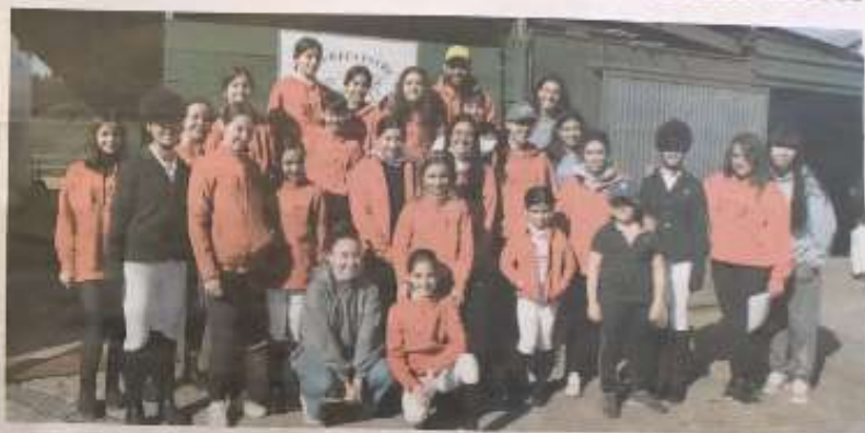
Participantes del centro hípico Arabian